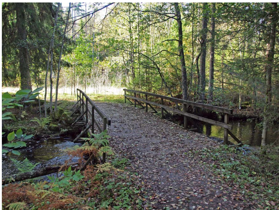
Bron behöver renoveras för att inte utgöra en direkt risk. Bräder bytes.

Sandared Intresseförening Kamvägen 15 518 33 Sandared