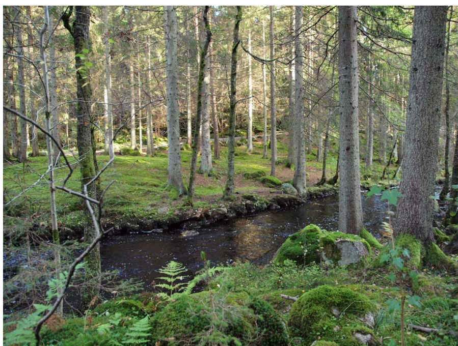
Vy från vilobänk på det upprustade spåret

Sandared Intresseförening Kamvägen 15 518 33 Sandared